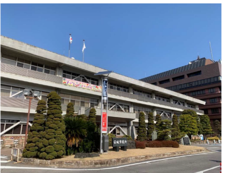
（現在の安城市役所）

【質問】安城市議会「未来型施設整備研究特別委員会」の最終報告書で、現在の庁舎は老朽化や狭あい化などの問題を抱えているほか、防災拠点としての安全性に不安があるため、庁舎の建替えを早急に検討すべきであると提言したが、取組状況を伺う。